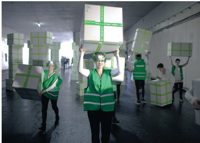
Tijdens de Dag van de Bouw verrasten dansers de bezoekers met 'bouwstenen', om zo de bovengrondse herinrichting te symboliseren.

Sinds vorig weekend is 'ie in de lucht: de gloednieuwe website www.mijngroeneloper.nl . En dat is niet voor niks. Want vanaf dit jaar gaat A2 Maastricht ook aan de slag met het ruim 2 kilometer lange en 30 tot 50 meter brede zandlandschap bovenop de tunnel. Het duurt nog een poos voordat de Groene Loper hier wordt aangelegd met bomen en nieuw vastgoed. De inrichting gebeurt bovendien fasegewijs. Voor de tussentijd wordt gekeken hoe