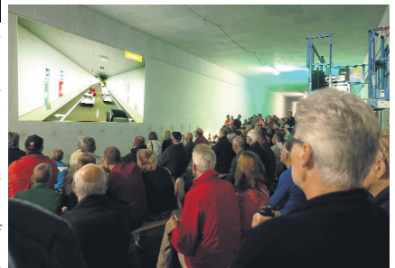
Tijdens de Dag van de Bouw zat de 'filmzaal' in de tunnel bij elke voorstelling vol.

Al deze vragen komen aan bod in een nieuwe film over het gebruik en functioneren van de dubbellaagse tunnel in Maastricht. Oftewel: de toekomstige Koning Willem-Alexandertunnel. Afgelopen zaterdag - tijdens de Dag van de Bouw - ging de nieuwe film in première. In een 'filmzaal' op locatie bereidden we onze